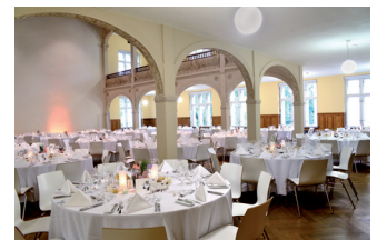
Dinner, Saal der Villa Elisabeth