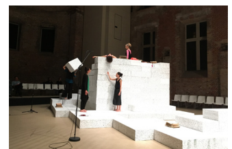
BAM/Nussbaumer: Der Opernwürfel