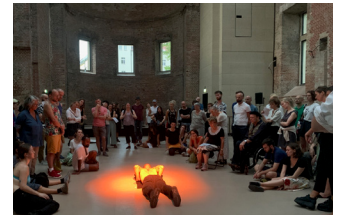
Tanz im August: Deep Space

Wir ermutigen alle fachlich geeigneten und interessierten Bewerber*innen ausdrücklich, unabhängig von ihrer Herkunft, ihrer Hautfarbe, ihres Geschlechts oder ihrer Geschlechtsidentität, ihrer sexuellen Orientierung, ihrer Religion, einer Behinderung oder des Alters, eine Bewerbung einzusenden. Hinweise zum Datenschutz finden Sie hier.