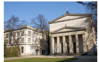
Außenansicht St. Elisabeth mit Villa