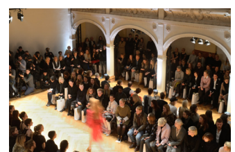
Modenschau in der Villa Elisabeth