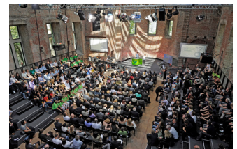
Schulpreisverleihung durch Angela Merkel