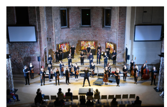
Junge Deutsche Philharmonie