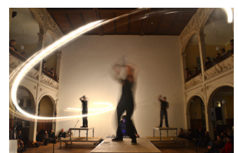
Performance „Speakers Swinging“