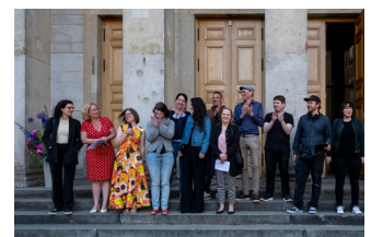
20 Jahre KBE - das TEAM!

Ev. Kirchengemeinde am Weinberg Invalidenstr. 4a, 10115 Berlin www.gemeinde-am-weinberg.de KBE: www.elisabeth.berlin